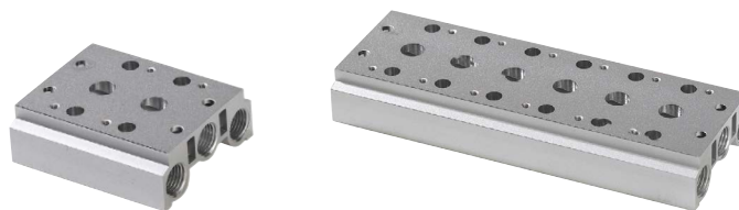
Manifold de 3 vías